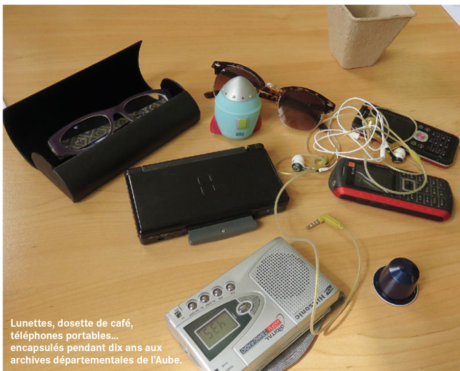
Lunettes, dosette de café, téléphones portables... encapsulés pendant dix ans aux archives départementales de l'Aube.

Ces capsules mémorielles ont été exposées en juillet à la médiathèque de Troyes Champagne Métropole. Le 31 octobre, elles seront déposées aux archives départementales de l'Aube, où elles seront protégées, pendant une décennie, dans les mêmes conditions que les documents les plus précieux. Un concours régional de photographie sur la mémoire du patrimoine industriel dans la région Grand-Est sera également lancé à l'occasion de la prochaine Semaine de l'industrie. Celui-ci sera ouvert aux jeunes entre 12 et 20 ans. •