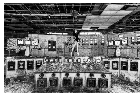
3 e prix : « 05h07 » - Laurent NISI (Moselle)