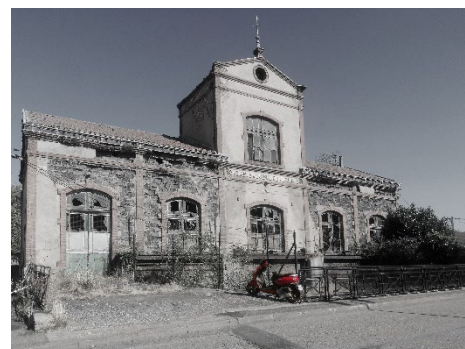
3 e prix : « Station électrique de Champy » - Elyne BIHAKY (Meurthe-et-Moselle)