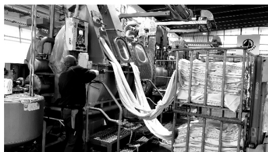
1 er prix : « On est dans de beaux draps » - Lucie SCHMITT (Aube)