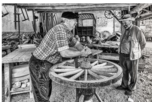
« Objet Merveilleux et Fascinant, la Roue » de Virginie THIBAUT (Meuse)