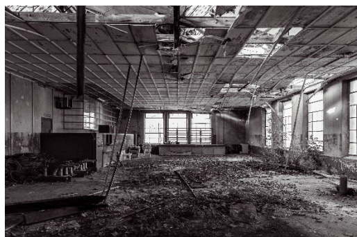
2 e prix : « La nature s'invite au réfectoire » - Timéo CHRISTOPHE (Meurthe-et-Moselle)