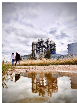
1 er prix : « UNILIN et sa face cachée » - Léa FREROTTE (Ardennes)